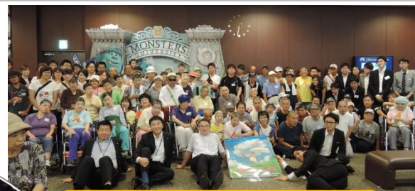
障害者の方々への無料上映会