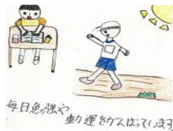
支援をさせていただいた方からの写真や手紙等