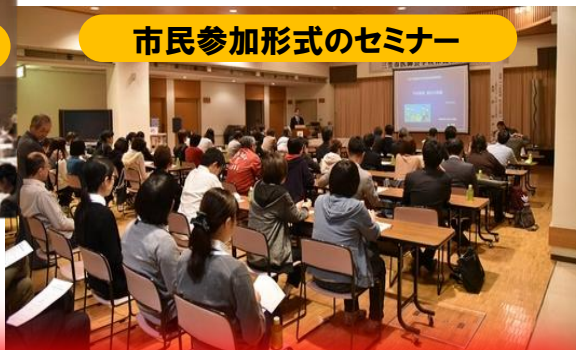
市民参加形式のセミナー