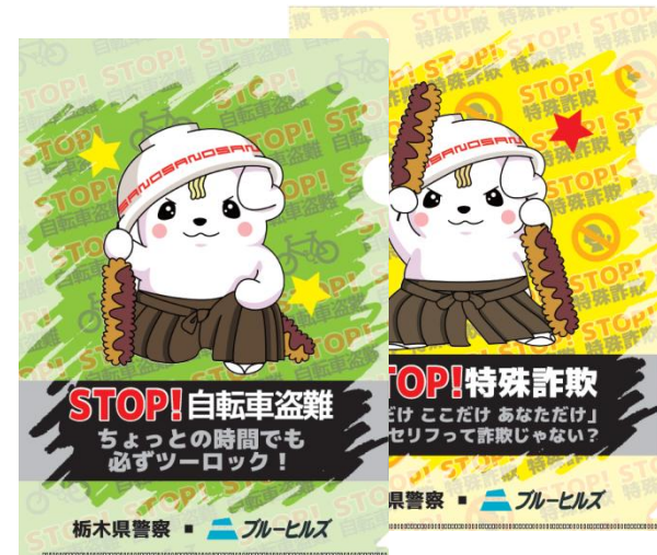
「さのまる」を使った犯罪抑止活動