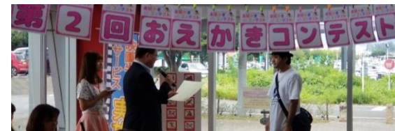
お絵描きコンテスト作品及び表彰式